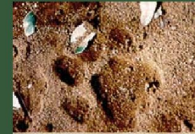
Dấu sư tử